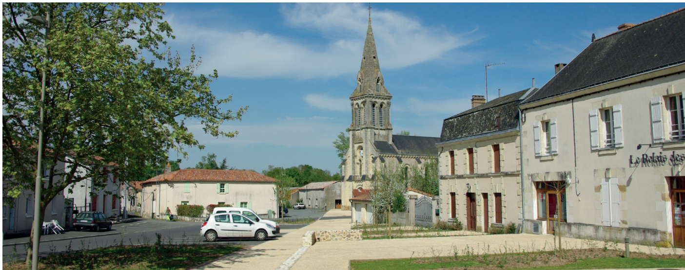
Aménagements de Bouillé-Saint-Paul, conception Denis Delbaere