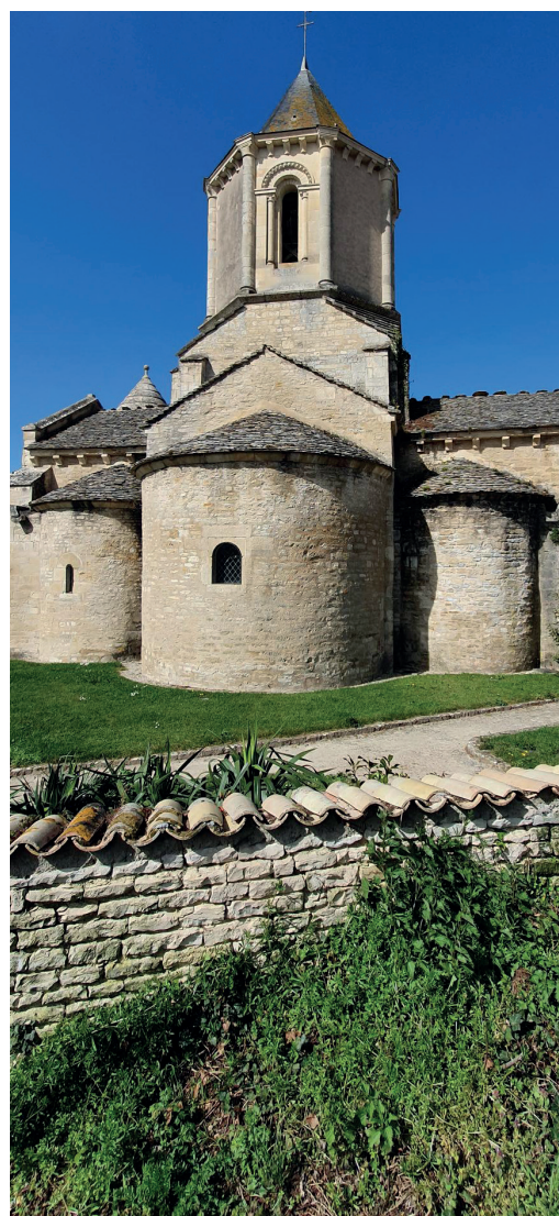
Église de Marigny