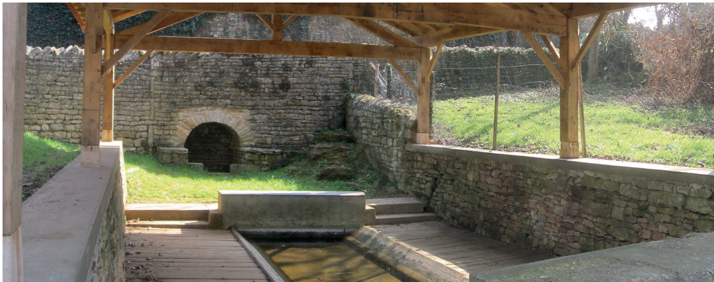
Lavoir à Sainte-Néomaye réhabilité par l'AIMS