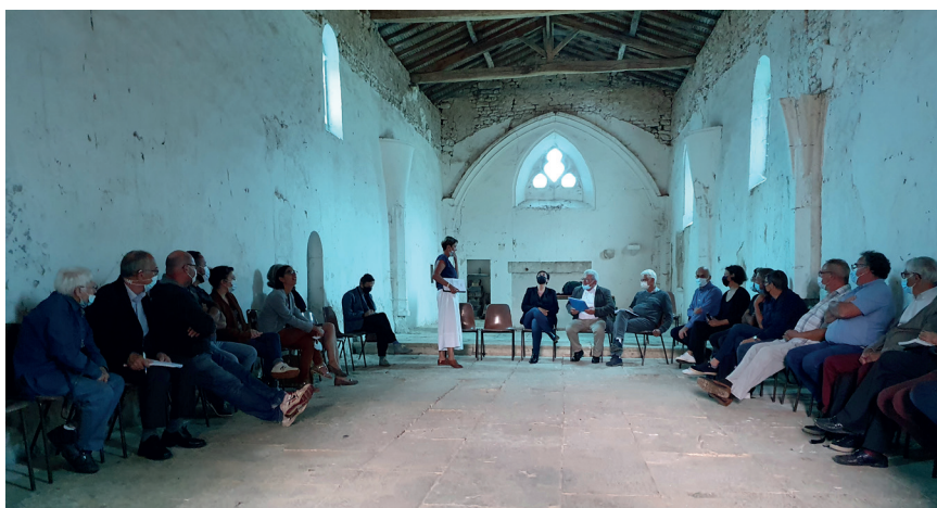
D'élus à élus - Réhabilitation des lieux de culte - Bougon