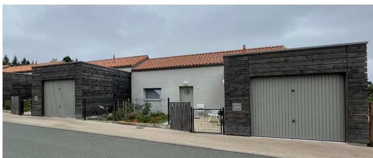
T3 accolés, gestion de l'intimité © CAUE79