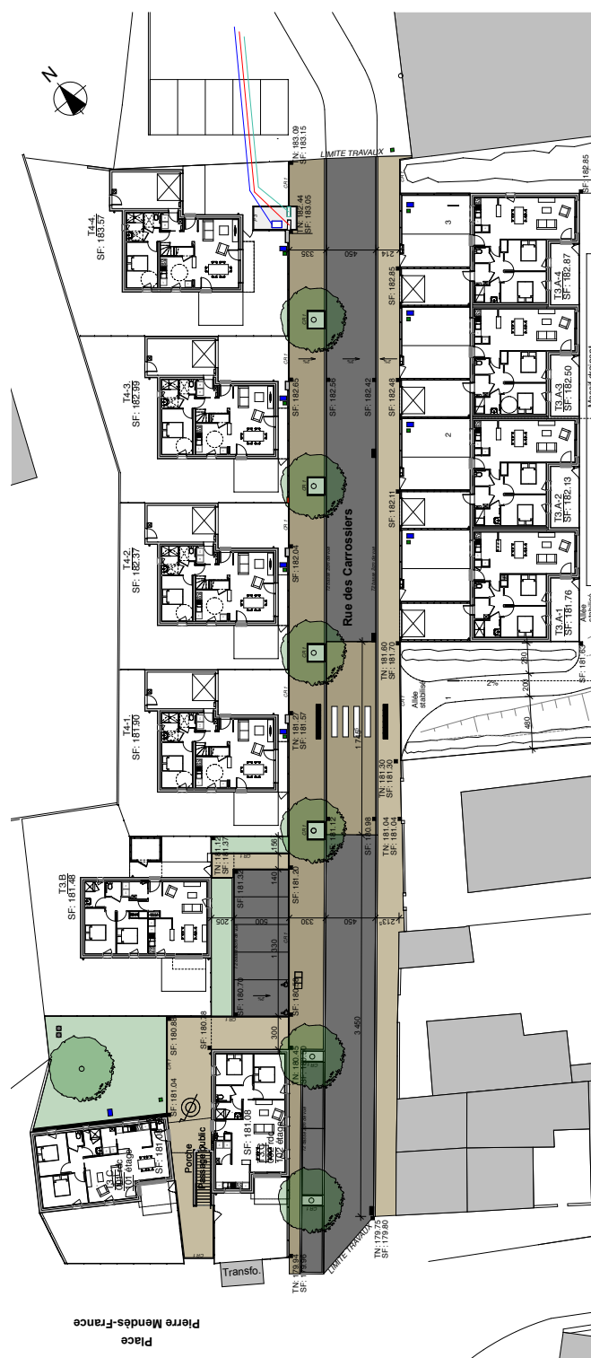
Illustration des principes d'aménagements © Jean Merlet