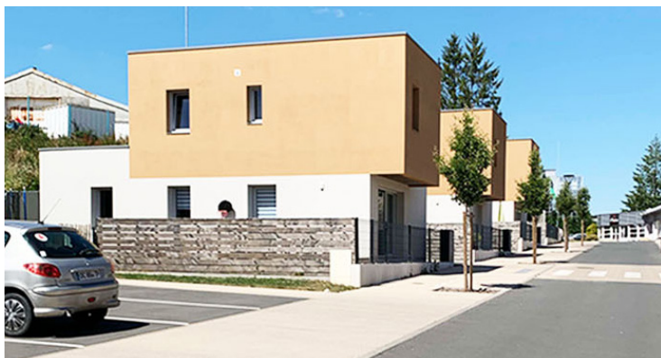
T3 duplex isolés © Jean Merlet

L'opération se situe entre la place Mendès France et la friche industrielle Heuliez. Le petit collectif implanté en angle marque l'entrée de la rue tout en faisant face à la place. En continuité, les T4 isolés s'affirment avec un volume R+1 en surplomb. Face à eux, les 4 T3 accolés ont une vue dégagée au sud. Les garages, en alternance avec les jardinets avant, créent un alignement sur rue.