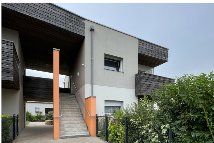
T3 superposés, gestion de l'intimité