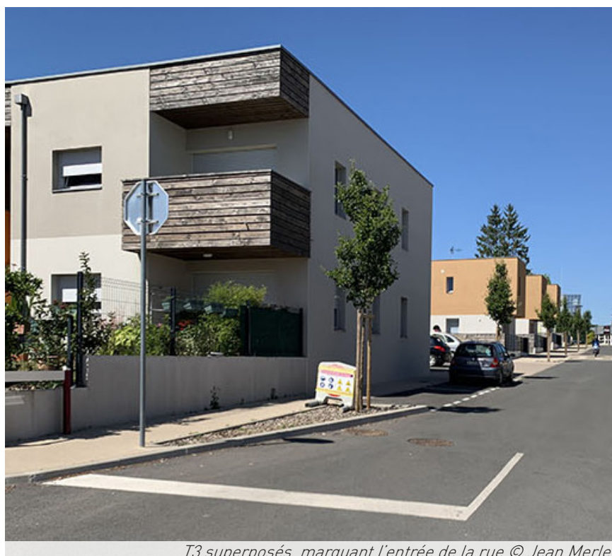
T3 superposés, marquant l'entrée de la rue © Jean Merlet