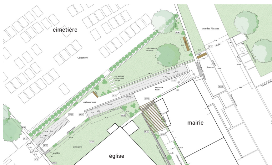
Plan d'aménagement du jardin du presbytère

L'importante végétalisation permet une infiltration directe des eaux pluviales. Le cheminement piéton est lui aussi perméable.