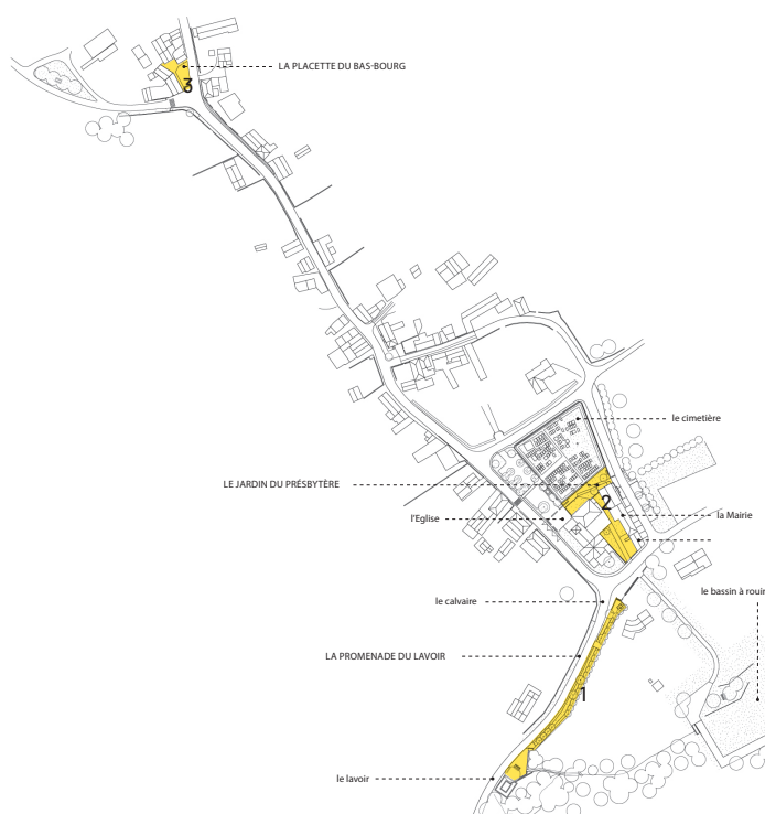
Localisation des sites d'intervention - Crédit document - Lalu

En 2015, la commune de Lhoumois décide de lancer une réflexion concernant l'embellissement de son bourg et de son patrimoine. Le bureau d'études « Lalu » mène alors une étude globale, sous forme de plan-guide, sur l'ensemble du bourg. L'aménagement est ensuite réalisé sur trois espaces : l'entrée du bourg avec une promenade vers le lavoir (1), le jardin du presbytère et les abords de l'église (2), la placette du bas-bourg (3).