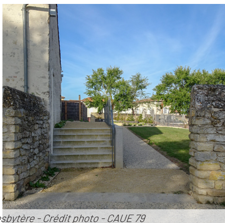
Abords de la mairie et accès au jardin du presbytère