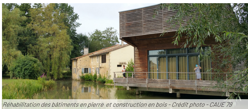
Réhabilitation des bâtiments en pierre et construction en bois - Crédit photo - CAUE 79