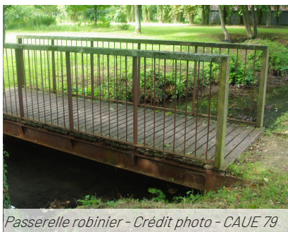
Passerelle robinier