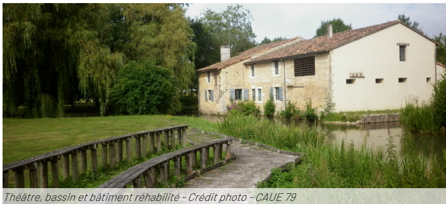
Théâtre, bassin et bâtiment réhabilité

Le travail des concepteurs s'est attaché à révéler la présence de l'eau. La zone humide, présente au cœur du parc, a été magnifiée par l'installation d'une passerelle sculpturale. L'aménagement d'un canal et la création de noues dans la prairie permettent de gérer les crues du Chaboussant. Les gouttières des bâtiments ne sont pas raccordées au réseau. Des noues infiltrent directement une partie des eaux pluviales et la mare d'hélophytes, située au pied du moulin, sert de zone tampon pour les volumes excédentaires avant rejet dans le cours d'eau. La toiture végétalisée inclinée participe à la qualité du site et temporeise le rejet des eaux dans le milieu naturel.