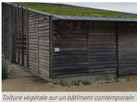
Toiture végétale sur un bâtiment contemporain

Cinq édifices en pierre sont réhabilités, dont le Moulin du marais qui reçoit désormais des bureaux, ainsi que trois constructions en bois réalisées selon une architecture bioclimatique. Les matériaux locaux ont été privilégiés : terre rouge du site pour confectionner les enduits et les briques, chanvre des agriculteurs du département pour isoler, et châtaignier rappelant l'architecture vernaculaire pour caractériser l'écriture des bâtiments contemporains. Les passerelles sont fabriquées en robinier. Un théâtre extérieur, lui aussi construit en bois, peut accueillir des représentations.