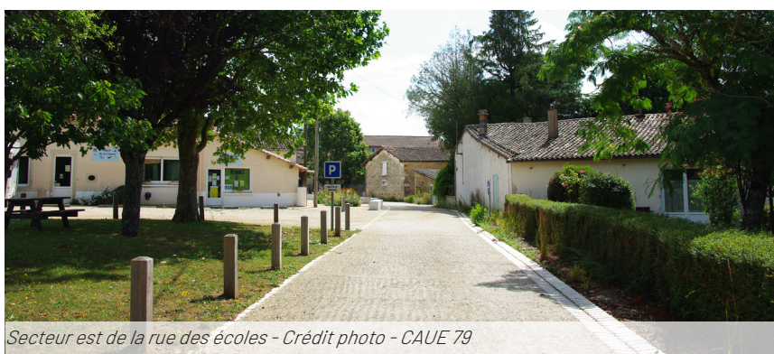
Secteur est de la rue des écoles