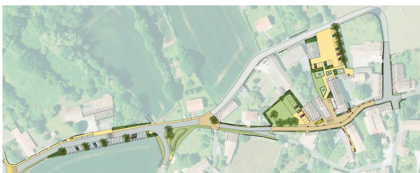
Plan de masse de l'aménagement du bourg

La traversée de bourg de la Pommeraye était totalement minérale avec une circulation à double sens pour les voitures. Or, cette rue, secteur principal de l'aménagement, concentre la plupart des usages quotidiens du bourg avec la présence de la mairie, de l'école, de la bibliothèque. En transformant cet axe et ses abords, la commune a souhaité sécuriser les déplacements piétons, tout en offrant au bourg une image de qualité en accord avec le cadre rural.