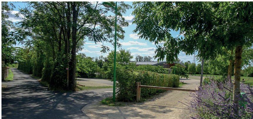
parking et entrée piétonne vers la salle des fêtes