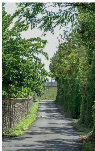
Détails des aménagements