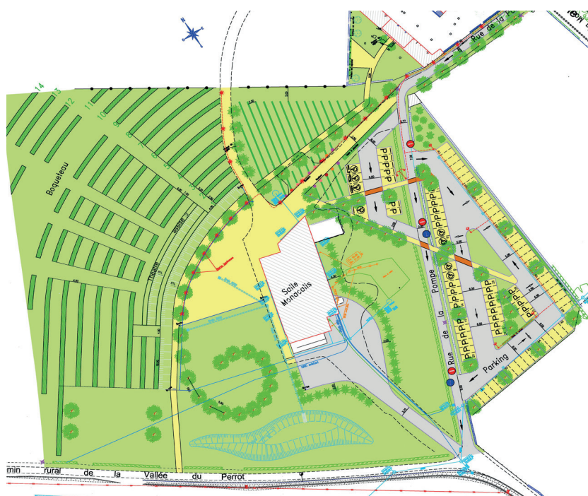
Plan de l'aménagement

Un travail de cheminements et de liaisons devait s'opérer avec la mairie et l'école toute proche. Le lien avec le paysage agricole environnant devait être le support d'un projet simple, en cohérence avec les moyens de la commune.