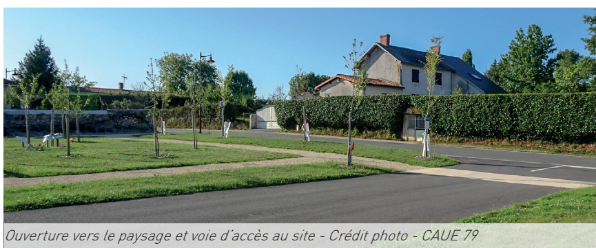
Ouverture vers le paysage et voie d'accès au site

Cet espace, qui rassemble de nombreuses activités pour les jeunes du village (jeux pour les jeunes enfants, city-park pour les adolescents, gradins verts ...), est devenu un lieu de vie et de promenade pour les habitants. Le parking permet aux visiteurs de se stationner à proximité, sans gêner les usages récréatifs. De plus, une vraie continuité visuelle s'opère entre les végétaux plantés et le paysage rural alentour.