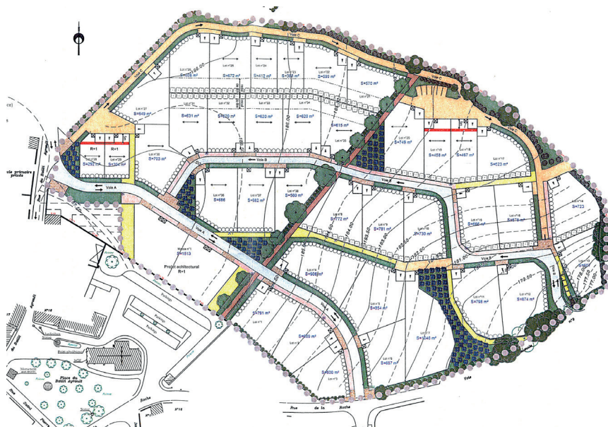
Plan masse du projet