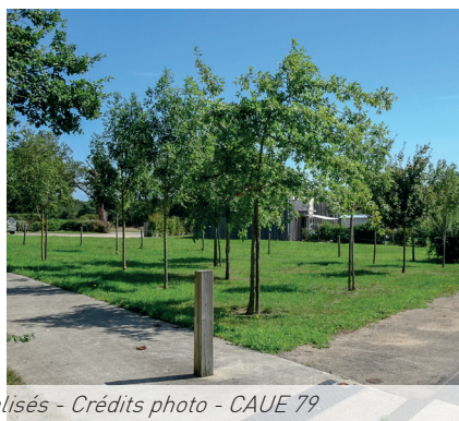
Des cheminements piétons sécurisés et végétalisés