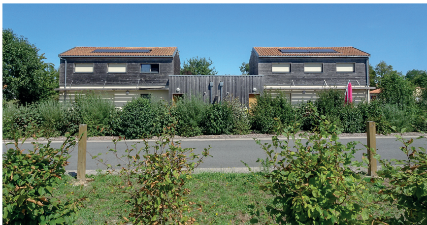
Des plantations généreuses en limite de parcelles

Tous les espaces végétalisés ont fait l'objet d'un pré-verdissement.