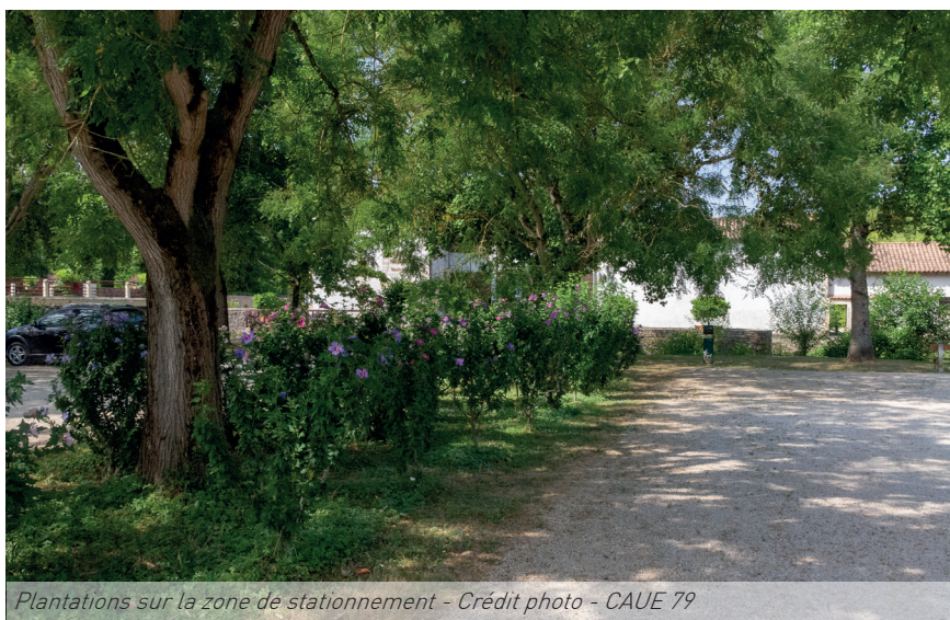
Plantations sur la zone de stationnement

Le cadre offert aux abords du moulin, et en périphérie du centre bourg, est apprécié des Mothais. La simplicité du projet, bien que réalisé en 1994, reste tout à fait d'actualité, laissant la part belle aux arbres et effaçant les contraintes techniques liées à l'aménagement d'une zone de stationnement.