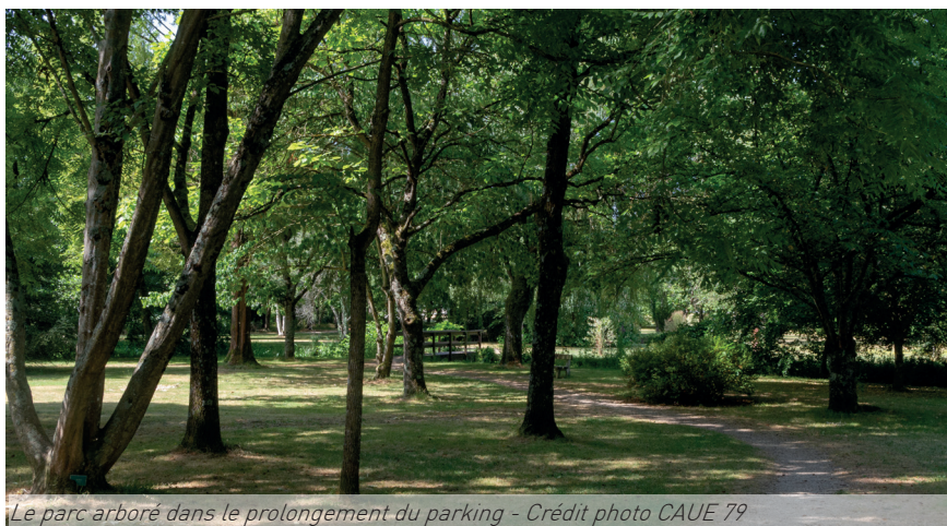
Le parc arboré dans le prolongement du parking