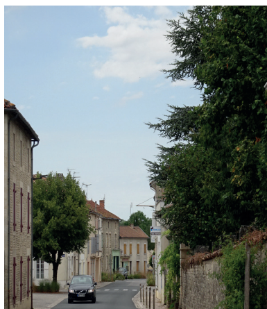
Centre-ville : Place de la Croix Perrine