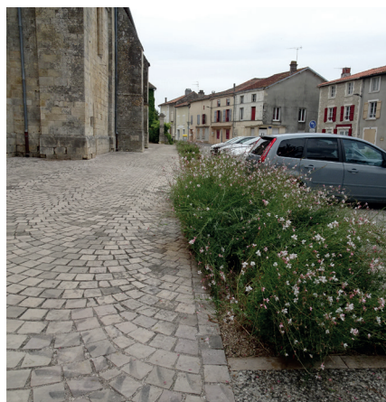
Parvis de l'église de Javarzay et traversée

Débuté en 2008, le projet consistait à transformer la route départementale traversant Chef-Boutonne et bordée de nombreux équipements publics, en une avenue agréable, structurante, pensée pour l'ensemble des usagers. Ce projet englobe également l'aménagement du parvis de l'église de Javarzay.