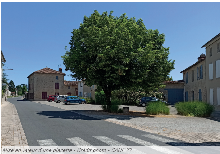
Mise en valeur d'une placette

Pour mettre en valeur certains carrefours, des rosiers et autres grimpantes ont été palissés sur des structures en bois et mailles de fer particulièrement élégantes.