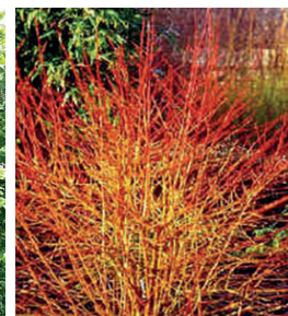
Cornus sanguinea - Cornouiller sanguin