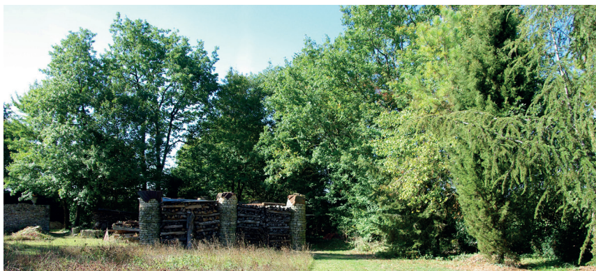
L'arbre au jardin

Quelle que soit l'essence choisie, l'arbre rendra de nombreux services. Il offre une fonction protectrice au jardin tout comme à ses propriétaires. Son houppier procure une ombre plus ou moins opaque en fonction du type de feuillage (feuilles simples ou composées, caduques ou persistantes). Cette ombre associée à l'évapotranspiration du végétal assure une fraîcheur précieuse en été.