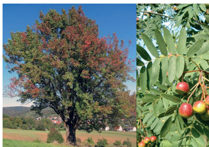
Sorbus domestica - Sorbier