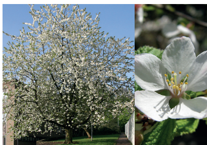
Prunus avium - Merisier