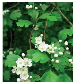
Crataegus laevigata - Aubépine