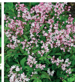
Deutzia gracilis - Deutzia