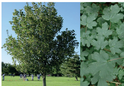
Acer campestre - Érable champêtre