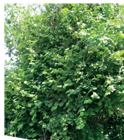
Corylus avellana - Noisetier