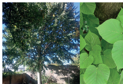
Tilia cordata - Tilleul